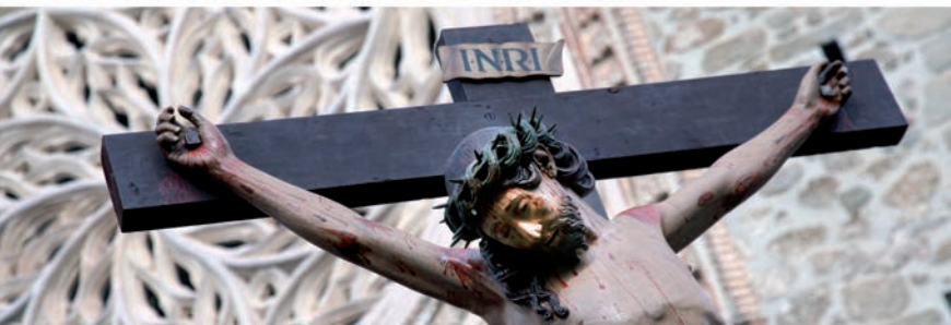
IMAGEN: CRISTO DEL MAR